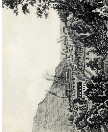
Guebwiller au milieu du XIXe siècle. Apparition de l'industrie qui marque profondément le paysage de la vallée. Lithographie.