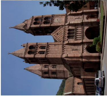
Eglise Saint-Léger, construite sous l'impulsion des Princes abbés de Murbach fin du XIIe siècle.